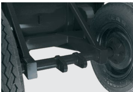
Engate para raspadeira dupla. Hitch for double scraper. Enganche para trailla (carriol) doble.