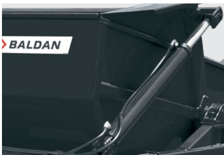
Sistema de basculamento por meio de pistão hidráulico. Dumping system by hydraulic cylinder. Sistema de basculamiento a través de pistón hidráulico.