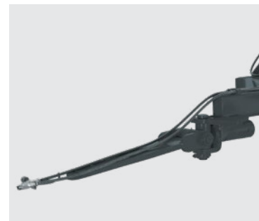
Engate de arrasto para o modelo RACR-T. Draw hitch for model RACR-T. Enganche para el modelo RACR-T.