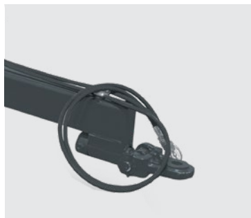
Engate de arrasto para o modelo RACR-L. Draw hitch for model RACR-L. Enganche para el modelo RACR-L.