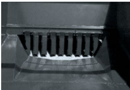
Lâmina de corte do modelo RACR-L. Cutting blade for models RACR-L Cuchilla de corte del modelo RACR-L (rueda trasera).