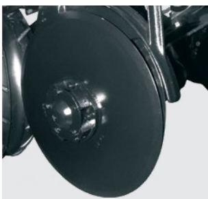
Disco duplo no adubo e na semente. Double disc in the fertilizer and the seed. Disco doble en el abono y en la semilla.