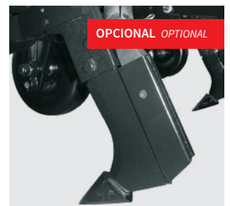
Sulcador pontiagudo com ponta removível para adubo. Furrower with removable point. Punta surcadora con punta removible.