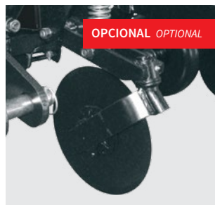
Disco de corte. Coulter disc (no till). Disco cortador.