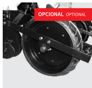
Roda compactadora de borracha. Rubber compression wheel. Rueda de compactación de goma.