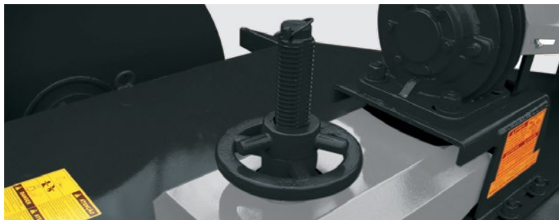
Sistema de regulagem das facas através de mandril, que regula altura de corte de 100mm a 320mm. Blade adjustment by thread axle that provide adjustment from 100mm to 320mm. Soporte para la regulación de la altura de corte de las cuchillas, desde 100 hasta 320mm.