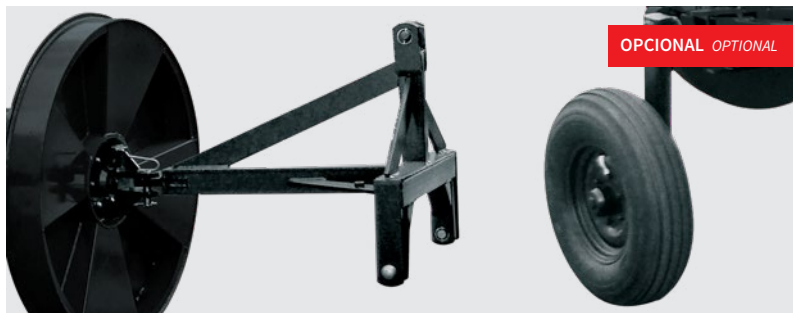
Transporte lateral. Side transport. Transporte lateral.