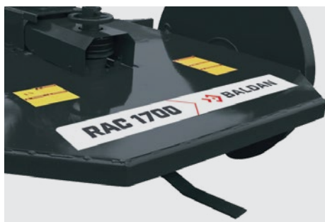
Caixa de proteção das facas em aço reforçado, aumentando a durabilidade do produto. Blade protection box made of high resistance steel. Caja de protección de las cuchillas de acero reforzado, aumentando la durabilidad del equipo.