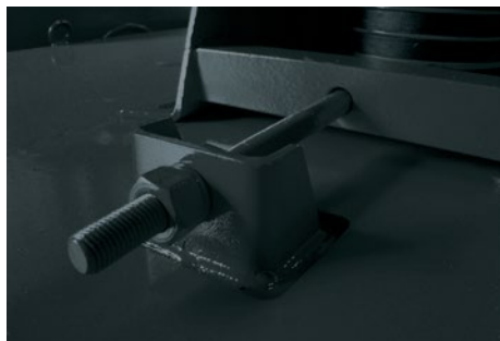
Sistema de ajuste de tensão das correias. Belt tension adjuster. Tensor para ajustar las correas.