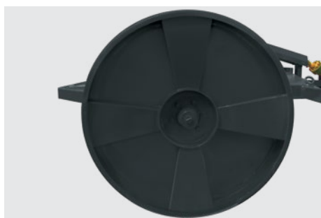
Roda reforçada para impacto de galhos com friso para que a roçadeira não se desloque no trabalho. Strong wheel that won't overreact to a bump in the field. Rueda reforzada con anillo para evitar desplazamientos laterales durante el trabajo.