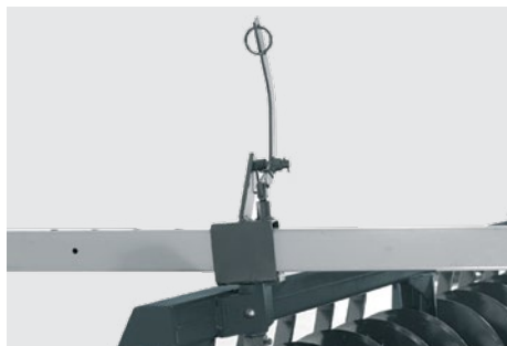
Barra de abertura e travamento. Device for opening and lock of gangs. Barra de apertura y trabamiento.