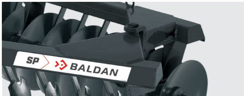
Estrutura construída por vigas tubulares de alta resistência. High strength frame. Estructura: vigas tubulares de alta resistencia.