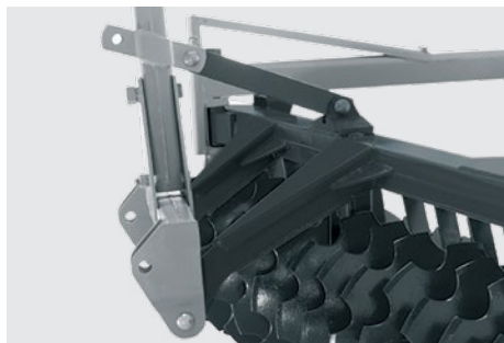
Engate: categoria de engate II. Hitch category II. Tipo de enganche: categoria II.