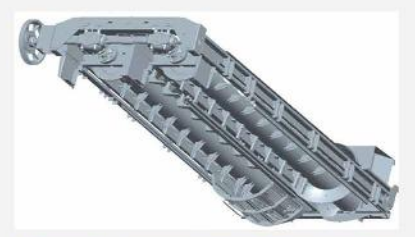
Mayor eficiencia con plantas verdes